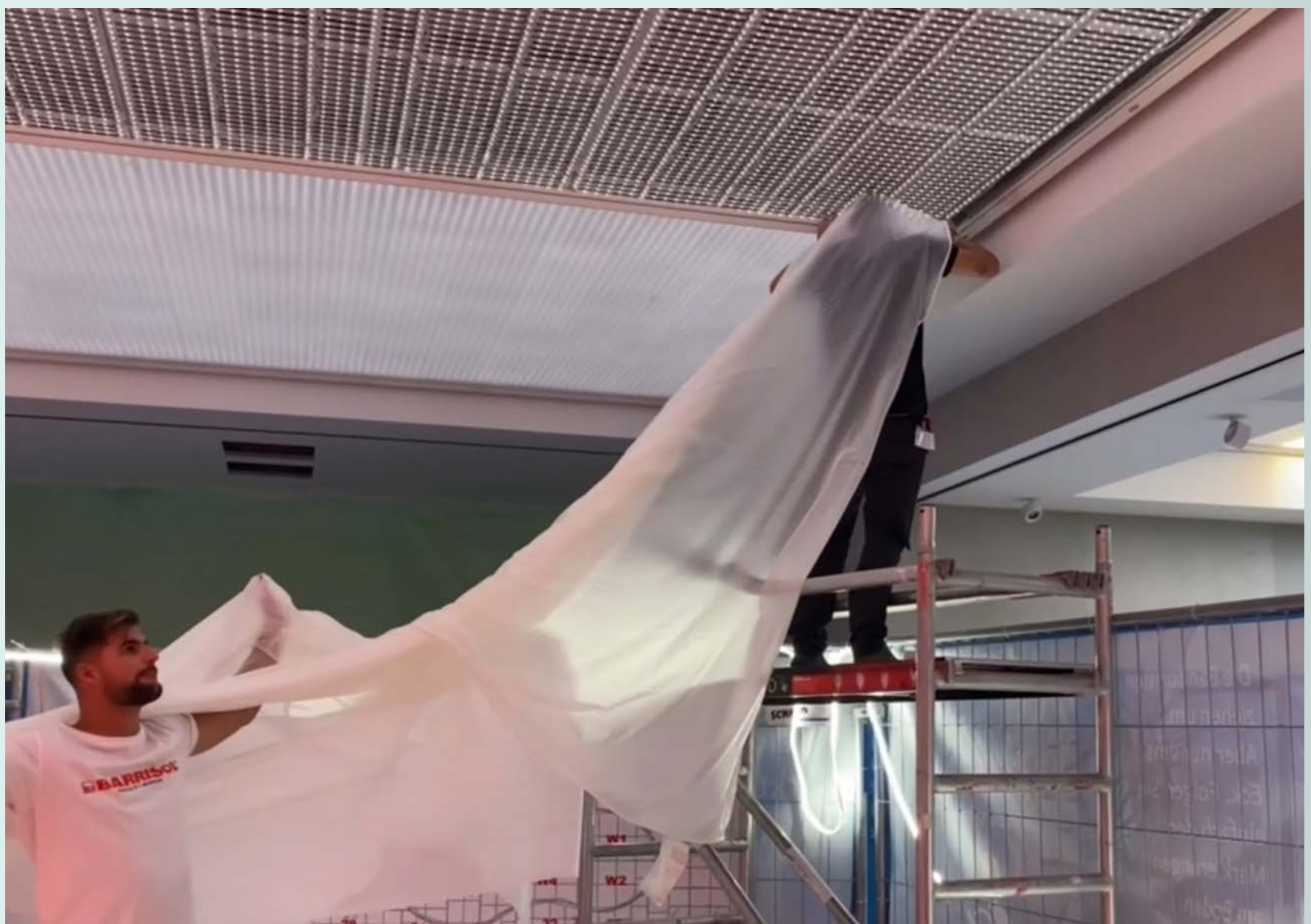
Bespannung mit abgestimmten Barrisol Folien für Akustik und Klimatisierung