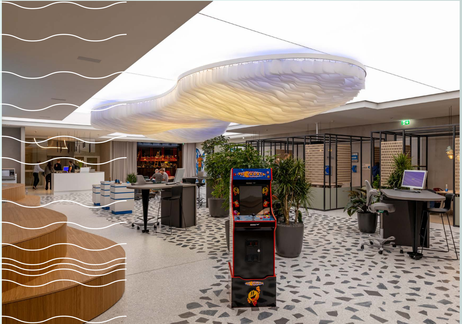
Tageslicht abhängige Lichtsteuerung