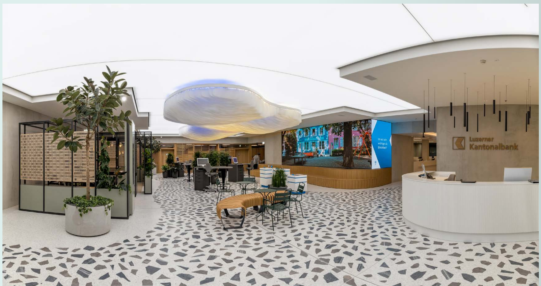
Die High-End Lichtdecke - das stimmige, einladende Zentrum der Markthalle

Die Realisierung dieses beeindruckenden Projekts brachte einige Herausforderungen mit sich und war nur in perfekter Zusammenarbeit mit den Architekten - Antonietty Architekten AG - und dem Baumanagement - Rogger Ambauen AG - sowie der Bauleitung der Luzerner Kantonalbank möglich. Die Koordination verschiedener Gewerke und deren Naturmaße erforderte präzise Planung - Zudem mussten Aspekte wie Netzwerkintegration, Kameras, Brandschutz und Lautsprecher berücksichtigt werden. Wir sind stolz auf das beeindruckende Ergebnis!