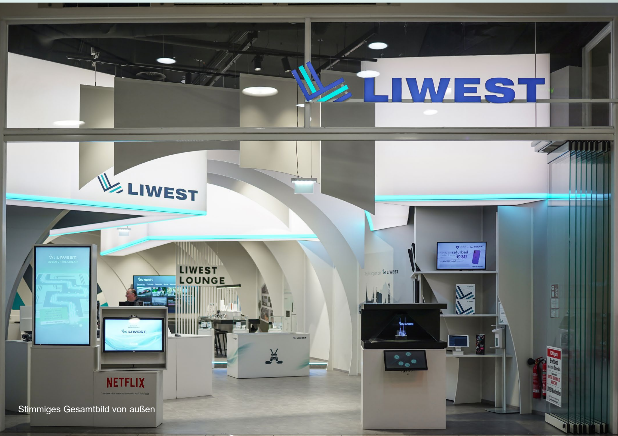
Stimmiges Gesamtbild von außen