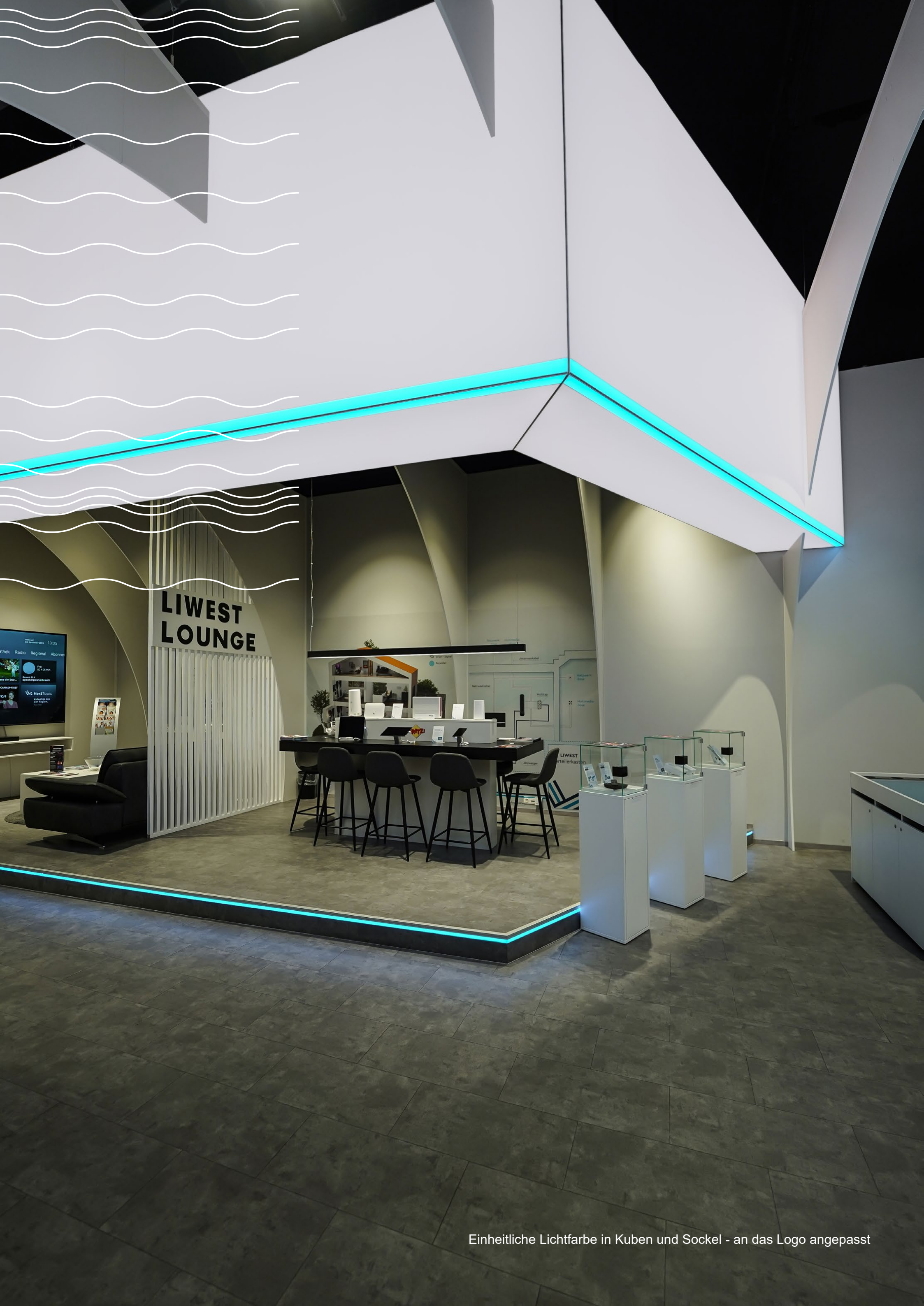
Einheitliche Lichtfarbe in Kuben und Sockel - an das Logo angepasst