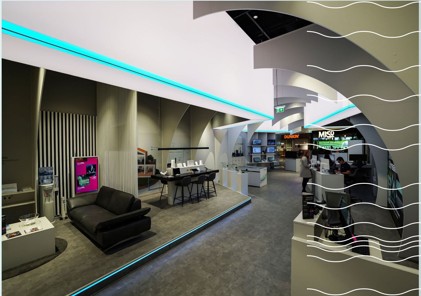
Hochwertige Materialien sorgen für absolute Nachhaltigkeit